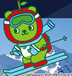
Nagano Pref. PR Character "Arukuma" ©Nagano Pref. Arukuma